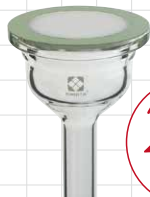
●ガラスフィルタータイプ