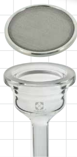
●サポートスクリーン(SUS)タイプ

本体はSPCとゴム栓タイプの2種類。フィルタースクリーンにはサポートスクリーン(SUS)とガラスフィルターの2種類とそれぞれ選択頂けます。